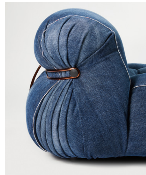
Soriana by Afra & Tobia Scarpa - Cassina Roy Roger's in edizione limitata è disponibile esclusivamente in Giappone.

N ell'universo del design e della moda, la sinergia tra estetica e funzionalità è sempre stata al centro dell'attenzione. Laddove la moda esprime la nostra individualità e il nostro gusto personale, il design gioca un ruolo fondamentale nel plasmare l'ambiente che ci circonda, rendendolo esteticamente bello e funzionale. Entrambi gli ambiti si influenzano e contribuiscono a modellare il nostro mondo con trend e motivi che si riflettono sia sulle passerelle che negli arredi. La poltrona Soriana by Afra & Tobia Scarpa - Cassina Roy Roger's rappresenta un meraviglioso esempio di come moda e design possano convergere per creare qualcosa di veramente speciale. Questa collaborazione unisce il meglio di entrambi i mondi, offrendo agli amanti della moda e del design un pezzo di arredamento iconico che incarna l'estetica e lo spirito innovativo dei due marchi. La poltrona Soriana, creata nel 1969 dal celebre designer spagnolo Afra e Tobia Scarpa, ha