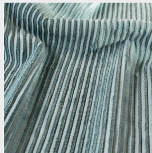
Velluto di lino C&C Milano

Come in un gioco, sveliamo l'oggetto misterioso per il quale il tessuto è stato pensato.